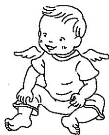
性格の場合もある。

日中ママと長くいる場合、パパに人見知りをする赤ちゃんも多いのです。わが子に泣かれるとショックを受けますが、ママの子育てが上手な証拠です。ママをほめてください。