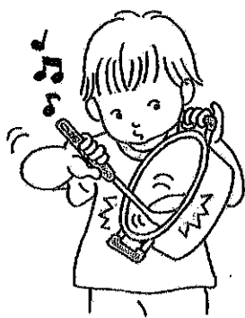
強くたたくと大きな音、弱くたたくと小さな音がする。