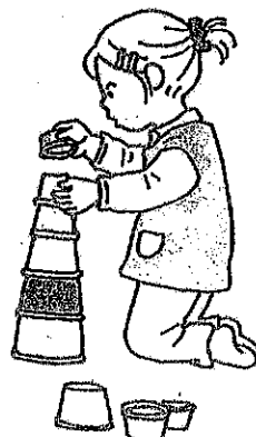
何度もやり直しができる。