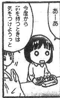
失敗によって学習します