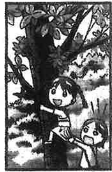
言うことを聞かないのは自立心の表れ