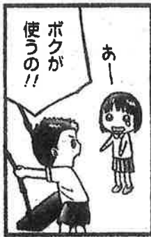
自己中心的なのは自己主張ができる証拠